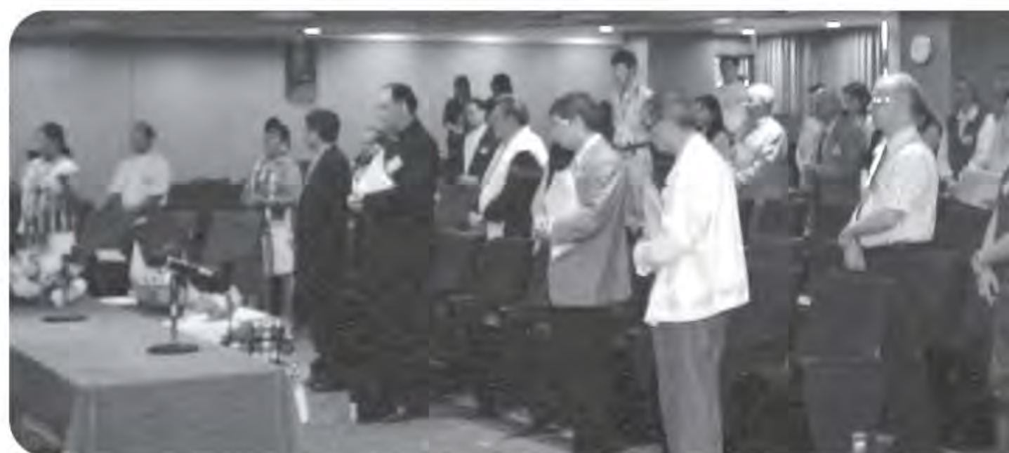
▲ 2004年4月30日，輔仁大學原住民服務中心主辦「天主教傳入蘭嶼五十週年紀念學術研討會」。

己的歷史位置，在台灣社會的主體論述中，不在被特定的大漢沙文主義中膽怯與缺席。原住民族的民族教育要依照這個邏輯，驕傲的說出傳統文化的精髓與民族的價值是什麼？獲得主流社會同樣的尊重與欣賞。另一方面，原住民族教育的功能，今日在台灣內部文化認同破裂之餘，統獨兩造的對立與矛盾，主流社會必須轉向原住民作台灣主體論述的中心出發，這是打破這個僵局的可能之途徑；台灣文化重構與努力過程，必須很清楚的將原住民文化元素納入整體社會結構，才是台灣文化的實質