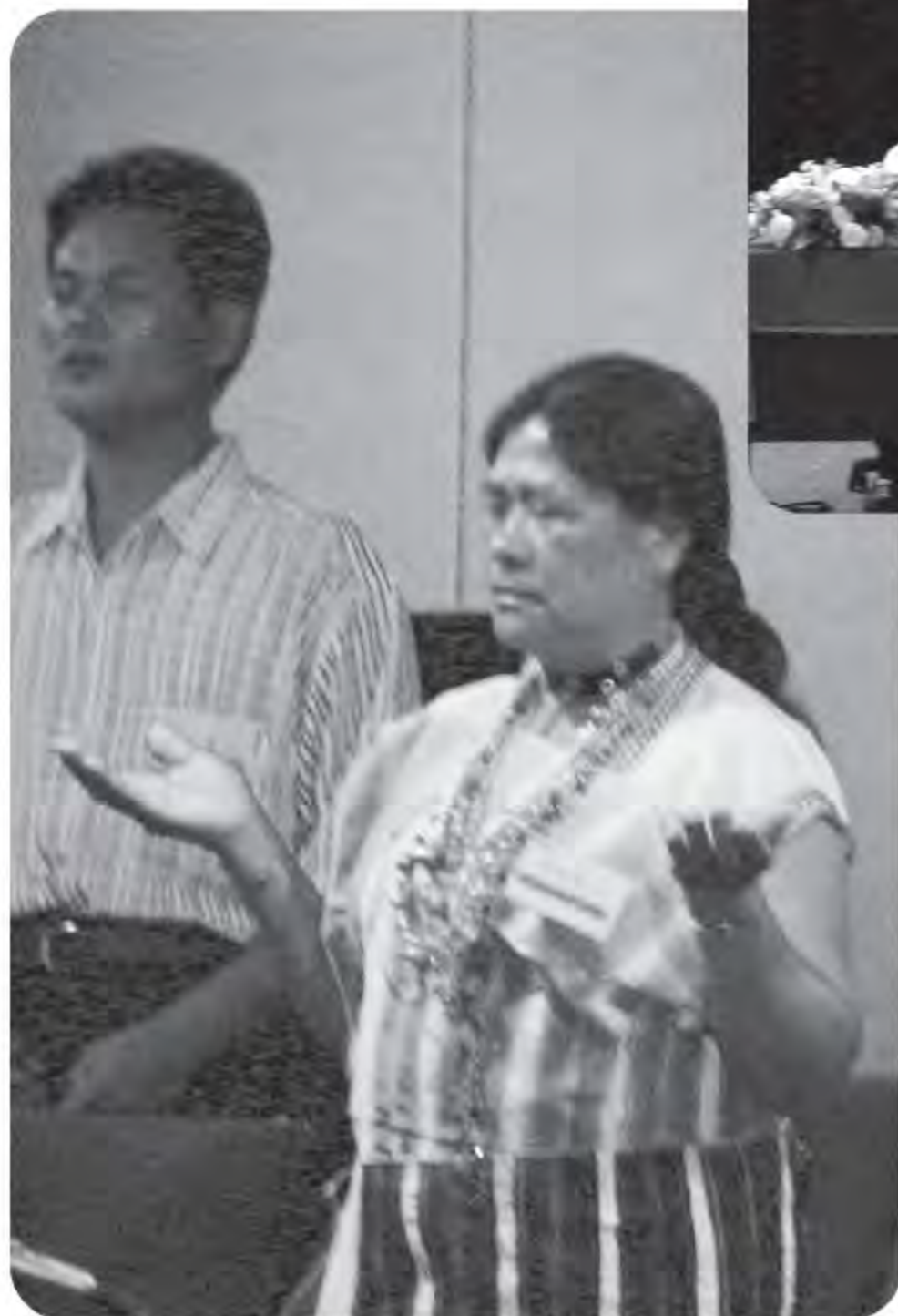
▲ 開幕祈福禱告儀式。