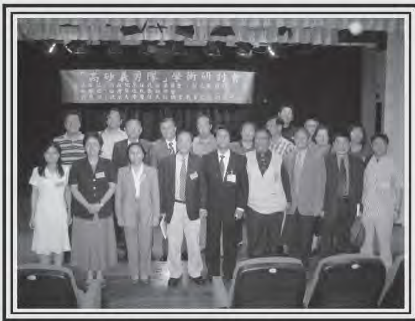
▲ 高砂義勇隊紀念學術研討會與會人員合影。

2006年5月26日（五）上午九時至下午五時，台灣原住民教授學會在文化大學推廣部建國本部B1表演廳舉行「高砂義勇隊」紀念學術研討會。