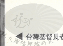
台灣基督長老教會總會及宣教中心大樓，位於台北市。