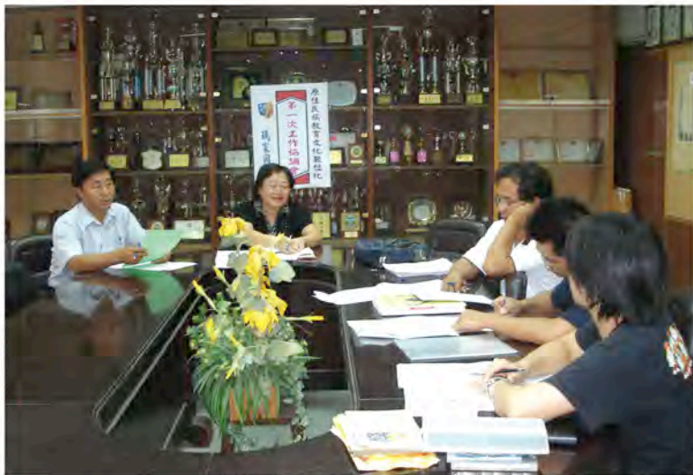
本校文化數位化編輯小組召開工作協調會。

連結，這二年來，上網連結之單位持續增加。為了擴大網絡，96年度及97年度，更進一步將既有的排灣族和魯凱族網頁製作地更為周延與豐富。