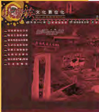
本校排灣族文化數位化網頁(首頁)