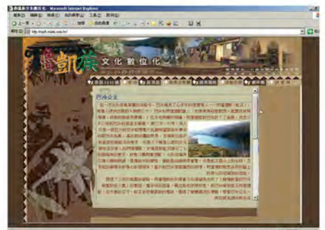
本校魯凱族文化數位化網頁故事篇(巴冷公主)。