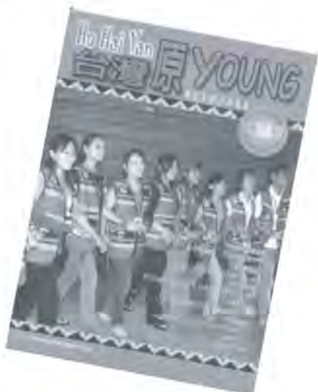
由左至右分別是《南島時報》、《山海文化雙月刊》、《原住民教育季刊》、《台灣原YOUNG—原住民青少年雜誌》。