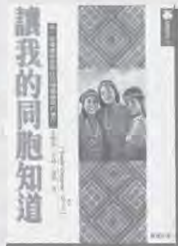
▶ 孔文吉（尤稀·達袞），1993 《讓我的同胞知道》台中：晨星出版公司。