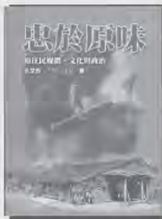
◀ 孔文吉（尤稀·達袞），2000 《忠於原味：原住民媒體、文化與政治》台北：前衛出版社。

住民族的尊重，在多元文化的社會裡是必須尊重的過程。孔委員也贊同推動族語教學，比如他自己就曾在台北市推動「原住民語言巢」的作法，這是學自於紐西蘭的原住民語言教學經驗，這也真正能讓原住民的孩子從小對文化有所認識，也對本身族群與語言能驕傲地認同和學習。