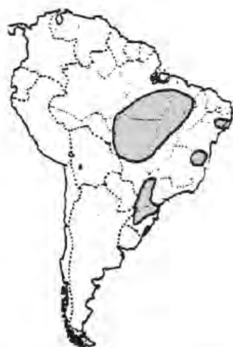
馬擴杰語系分佈圖