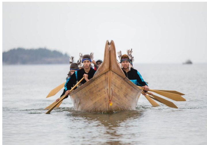
獨木舟是Lummi族的傳統交通工具。