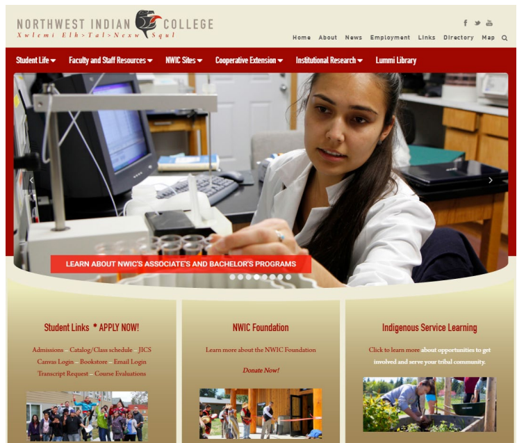
西北原住民族學院網站首頁，校址位於華盛頓州Lummi族保留區。

NWIC大多數學生是美國原住民族，尤其是阿拉斯加州的原住民族，也有少數加拿大原住民族學生。學校課程將在地知識、在地生活