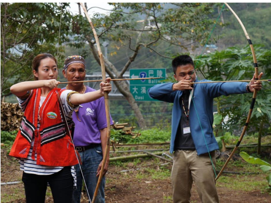
在泰雅族部落的獵人學校學習拉弓，淺嚐獵人夢。

原住民族委員會以「拜訪部落」為主題，設計出25條旅遊路線。這25條旅遊路線，來自不同的地區與民族，它們擁有各自不同的特色，只要想好自己的需求，計畫旅程也就不這麼困難了。