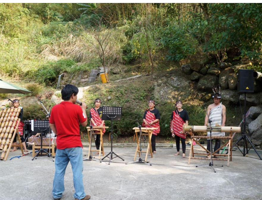
竹頭角部落的木琴表演，雖然還不夠嫻熟，但部落族人齊心傳承古老歌謠的模樣，很讓人動容。