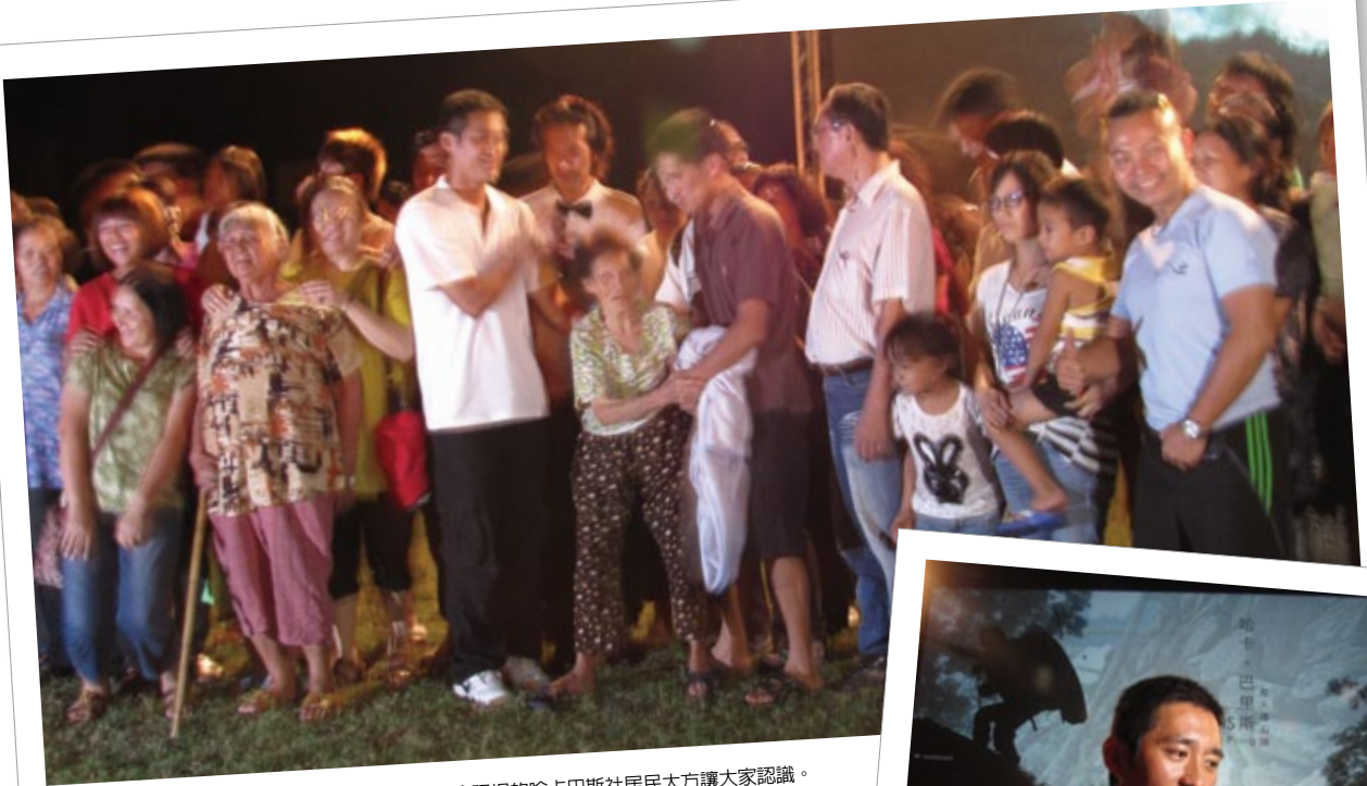
在韋文豪老師的呼喚之下，《哈卡巴里斯》首映會現場的哈卡巴斯社居民大方讓大家認識。