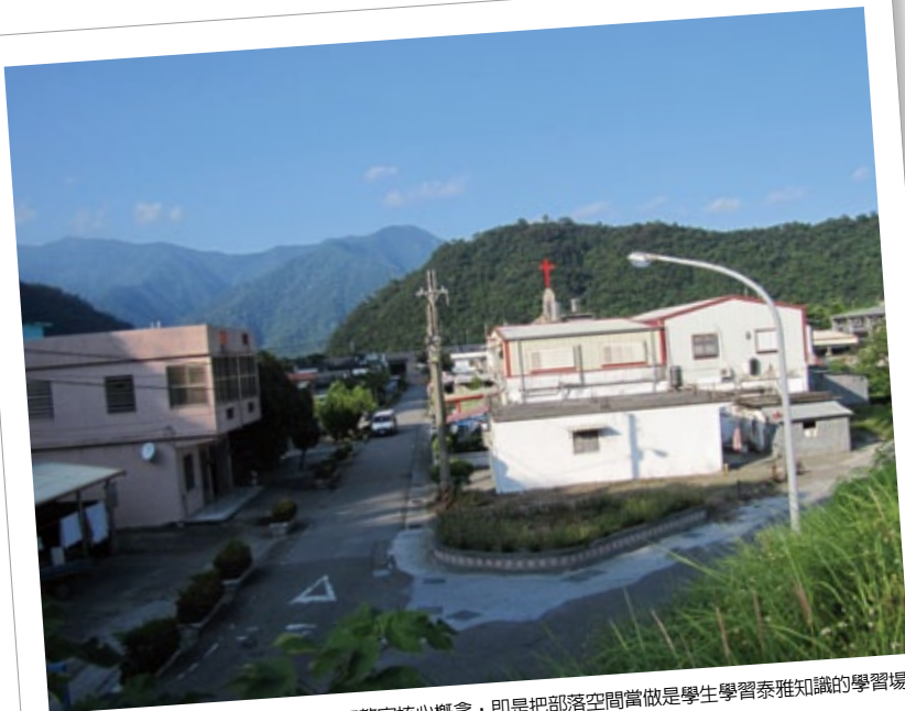
宜蘭縣11所重點小學的民族教育資源教室核心概念，即是把部落空間當做是學生學習泰雅知識的學習場域，圖為南澳鄉武塔社區。

宜蘭縣原住民部落大學，當年是由宜蘭縣國民中小學的原住民教育人員，由下而上來創立經營，後來才獲得政府的補助。部落大學雖是民族教育的火車頭，但目前只有開設部分「文化學程」及「社區及實