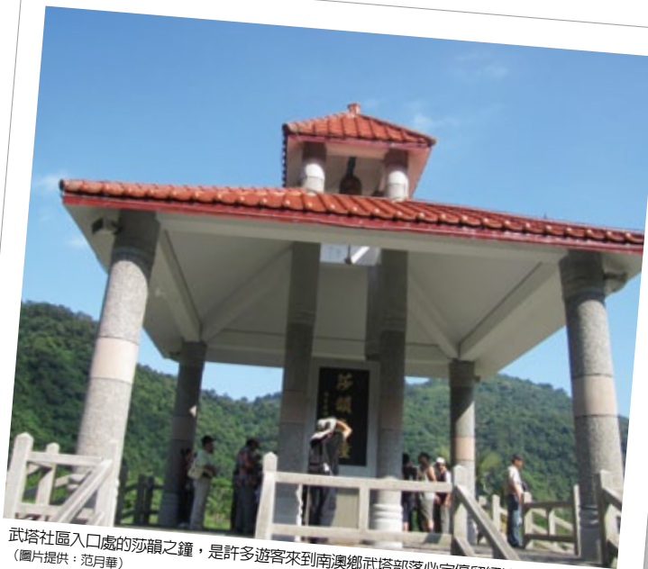
武塔社區入口處的莎韻之鐘，是許多遊客來到南澳鄉武塔部落必定停留緬懷歷史的地方。