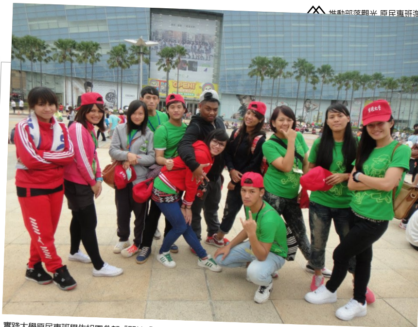
實踐大學原民專班學生組團參加「開懷「走」「跑」趣：心理健康路跑暨健走活動」。