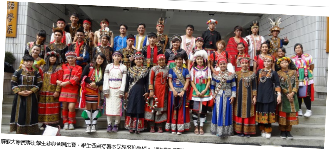
屏教大原民專班學生參與合唱比賽，學生各自穿著本民族服飾亮相。

迭，只能根據學校網頁的說明來看該校專班的特色。大葉大學相對另外3個原民專班，更重視餐飲管理的部分，因此課程設計包括烹飪技術、飲食文化、食品安全等選修課程，試圖從餐飲的角度切入，藉此提升休閒觀光的品質。專班的學生也必須修習原民文化的相關課程，學生不僅了解原住民族的飲食文化與歷史脈動，還能將餐旅管理的專業知識結合在一起，發展出民族特色的休閒觀光餐旅產業。