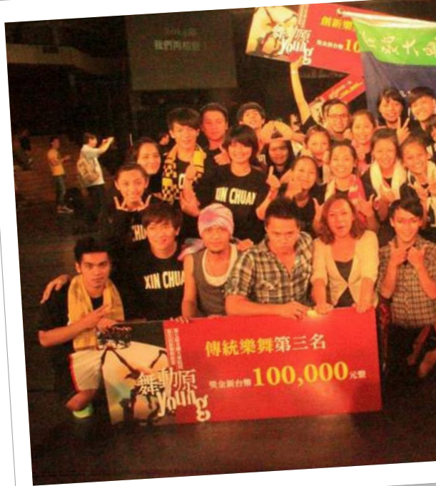
實踐大學原民專班學生參加「舞動原young」原住民族樂舞競賽，榮獲第一名。

個有趣的現象，學生當中，有一半來自花東與南部的原鄉，另一半則來自中部或北部的都會區，這讓他們產生不同的學習適應。來自原鄉的學生通常很快就投入原民文化的課程中，可是來自都會區的學生，必須經過自我認同的過程，才能逐漸接受原民身份、擁抱原民文化。主任認為，都會區的學生適應過程雖然較長，但之後的表現往往更突出，這是在專班的教學中，一項特別的收穫。