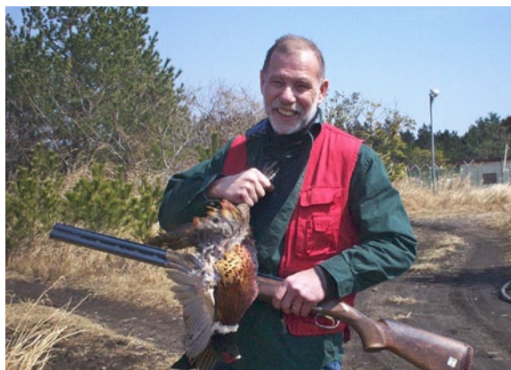
大韓民國建國後，最早設立的固定狩獵場在濟州島（1967年）。圖為濟州島 Dayoo 狩獵保留地。

有關違法判罰，共有四個標準：一、處100萬韓元（約3萬台幣）罰金之罪，如未攜帶狩獵資格證狩獵、狩獵區域標示損毀等行為。二、處1年以下有期徒刑並處300萬韓元（約10萬台幣）罰金之罪，如將本人狩獵相關許可證件借予他人等行為。三、處2年以下有期徒刑並處500萬韓元（約15萬台幣）罰金之罪，如狩獵超過法定地點或數目等行為。四、處3年以下有期徒刑並處1000萬韓元（約30萬台幣）罰金之罪，如以危險手段捕獲瀕