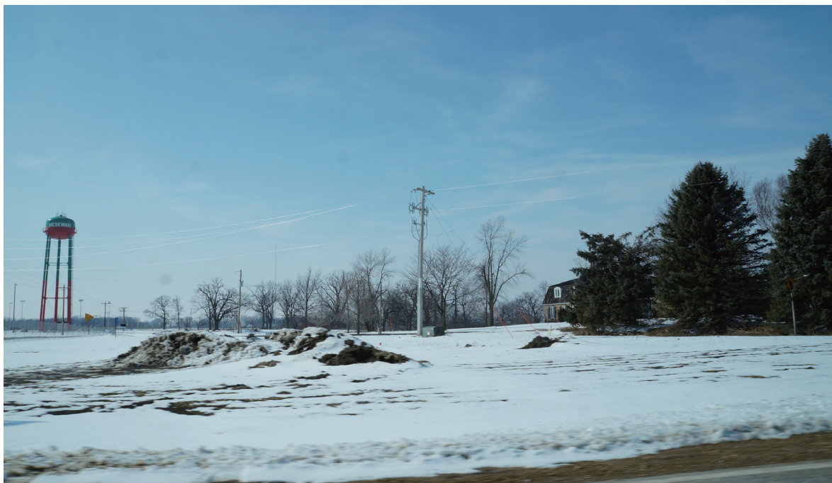
Meskwaki (美斯奇基族) 居住的部落稱為settlement (聚居區)，寫著族名並漆成民族識別顏色的水塔，為部落的地標。

個社區的人或一群人為原住民部落，即可將其納入國會的權力範圍內，但是，一旦他們需要美國政府的保護，國會有權認定其是否為原住民部落，而非由法院認定。聯邦的原住民部落認定賦予部落取得特定津貼的權利，而聯邦的原住民部落認定，大致由印第安事務局主導。