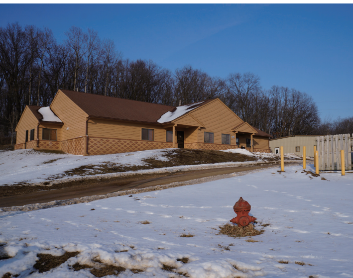
Meskwaki (美斯基族) 的民族警局。