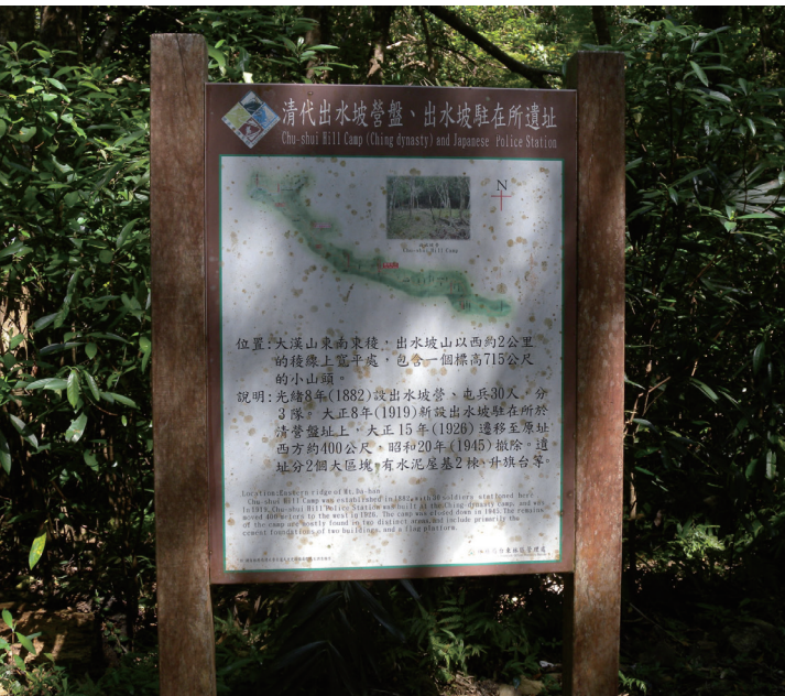
2013年3月至浸水營古道踏查。

此外，文獻的掌握與分析為歷史系學生的重要訓練，本課程亦配合上課的進度，進行文獻研讀，包含故宮奏摺、淡新檔案、古文書、台海使槎錄、清代地方志、沈葆楨與劉銘傳等文集奏摺等中文史料。然而在每週2小時的授課時間內，文獻研讀的時間亦相當有限，只能挑選部分檔案做全文的研讀，其他則選擇段落文字加以說明強調。在參考用書方面，本課程未指定教科書，以開列參考書目的方式，在課