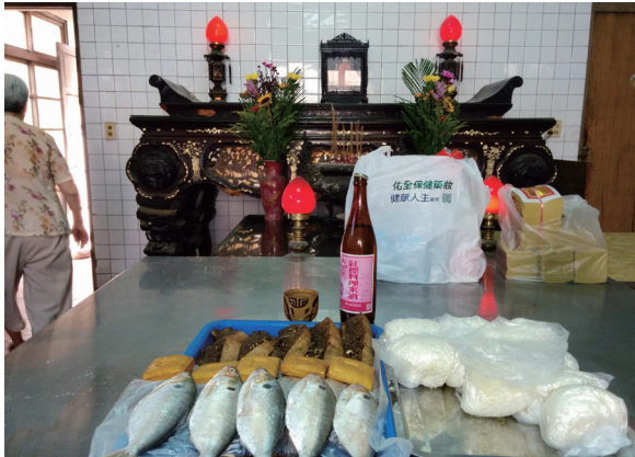
2014年8月的沙轆社祭祖活動。