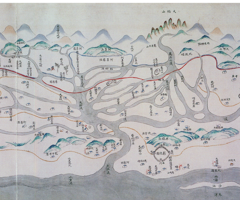
「台灣原住民族史」課程教材：大肚溪南北二岸番界圖（紅線與藍線標示部分）。 圖片出處：「台灣民番界址圖」（南天書局、中央研究院歷史語言研究所共同出版，2005）

17世紀後，原住民族被納入國家體制的過程，為本課程的探討重心，其結果造成原住民族在台灣歷史發展的過程中逐漸被邊緣化與弱勢化。本課程期能由歷史的縱深，讓選課學生思考與瞭解造成當前原住民族處境的歷史因素。