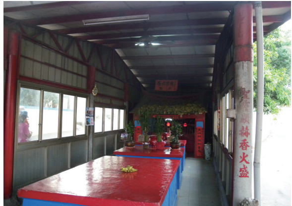
2014年10月前往大肚平埔族踏查：族人的古墓。

程進行中提示同學可進一步參閱某些專書或論文。至於田野參訪，則以就近訪查為主，如本學期（103學年度下學期）帶領同學前往沙鹿市區探查沙轆社舊址，祭祀祖祠，輔以文獻導讀，使同學瞭解沙轆社與漢人聚落發展的相對關係。