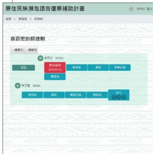
族語傳承師平臺操作畫面。

為了瞭解族人每日使用平台的動態及迅速處理所遇到的問題和狀況，平台正式開放使用的前2個月，專管中心的助理下班後會到不同地點下測試手機、筆電和平板。平台開放後，