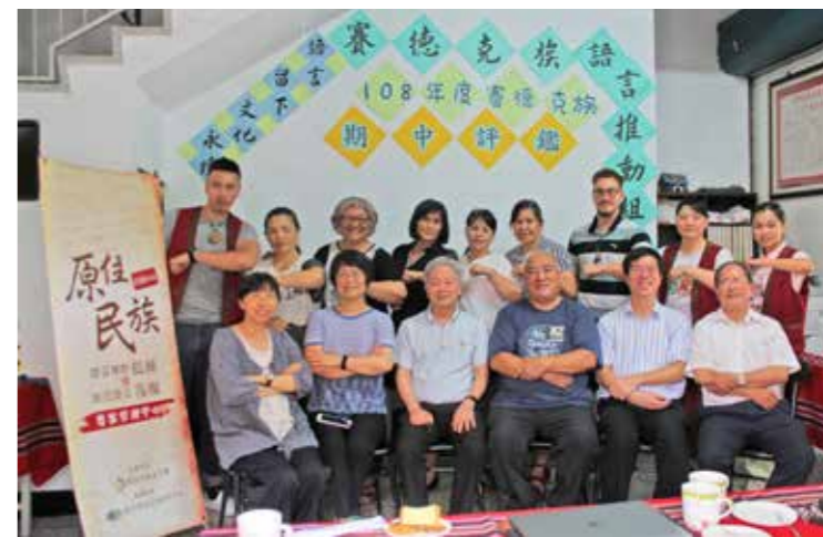
期中評鑑合照（後排左四）。

透過盤點，我們希望能喚醒部落青年對部落語言與文化傳揚的使命，蒐集之影音資料，建置於賽德克族數位典藏資料庫，供本族研究