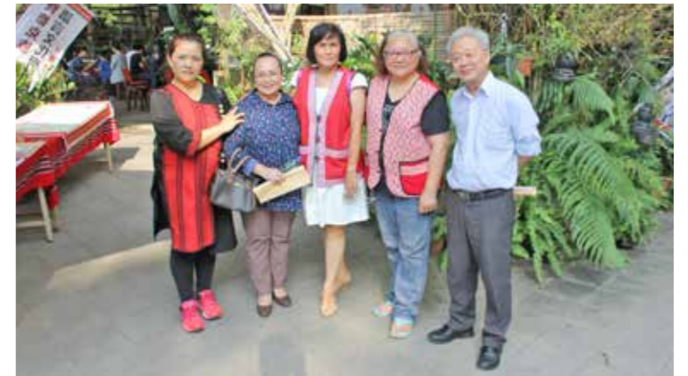
賽德克族語言文化學會成立大會。