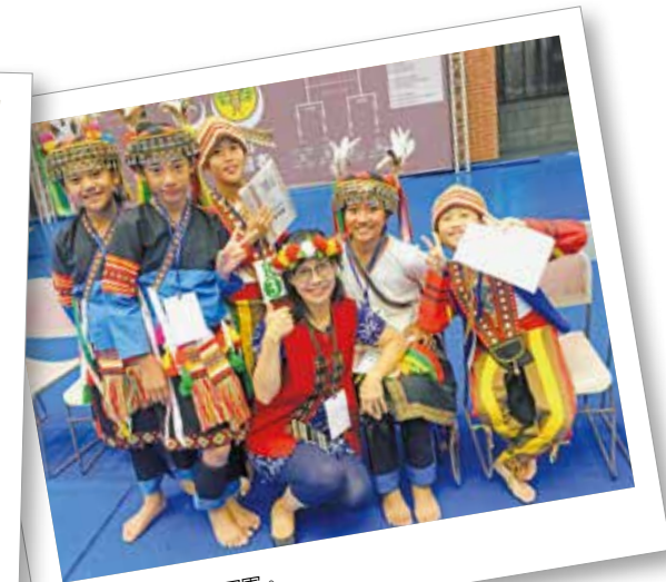
參加單詞競賽獲得冠軍。