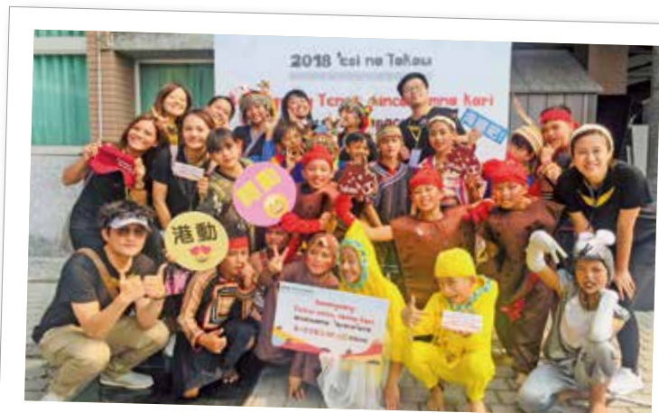
參加第八屆全國原住民族語戲劇競賽團隊合影。