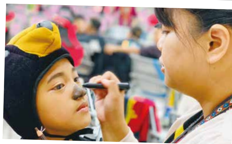
戲劇比賽前替參加學童化妝。

族語夢工廠「北斗七星」的族語動畫劇情，描述族人因為狩獵趕不上祭典，幻化成為天上的星星。以「族語戲劇」去貫穿課程，除了可以反映「綜合藝術」的表現，更希望教學中心是「兒童」，以「故事性」的手法去包裝「文化」，讓學生可以與傳統接軌，而不感到矛盾與突兀。換言之，透過族語戲劇作為民族教育發展的主題，就可以將民族精神、民族制度、民族藝術與民族生活等文化層面，以整體性的方式融入學童學習歷程，取代過去片段的、零散的學習模式。而在教學的手段上，強調創意啟發、多元體驗、情境佈置乃至於延伸探究，希望能達到認同產出、反省回饋、生活實踐最後能傳承永續的有效目標。