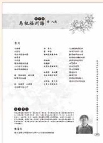
2008年閩客語文學獎馬祖語「詩」入選作品賞析（出自教育部語文成果網）。