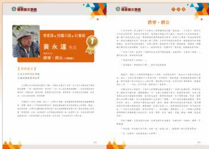
閩客語文學獎歷屆作品可於網路上瀏覽。