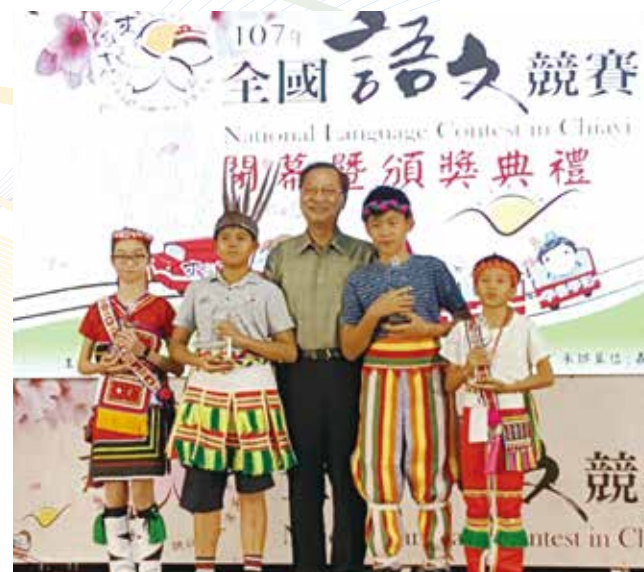
2018年全國語文競賽開幕暨頒獎典禮。

原民會自2013年迄今，已舉辦五屆「族語單詞競賽」，主要目的增進學生對於本族族語單詞（族語學習詞表）的熟悉度，提升原住民學生聽、說、讀、寫的能力，並增加參賽學生使用族語的機會。根據去年（2019年）第五屆競賽的統計，共計75隊報名，參賽選手連續兩年皆超過500名，參賽語別有20個語別，國小組由高雄市的拉酷斯隊（郡群布農語）及屏東縣的望嘉勇士隊（中排灣語）並列冠軍；國中組由南投縣民和國中的希哈喇隊（卡群布農語）獲得冠軍；瀕危語別國小組由高雄市興中國小的Ruhluca（拉阿魯哇語）獲得冠軍；瀕危語別國中組由高雄市的瑪寧召隊（卡那卡那富語）獲得冠軍，獲獎隊伍的獎金總計88萬元。族語單詞競賽的參與對象為國中及國小學生，原民會希望藉由單詞熟背的策略，對學生在往後教育階段的句型學習及短篇文章的習讀有所助益。