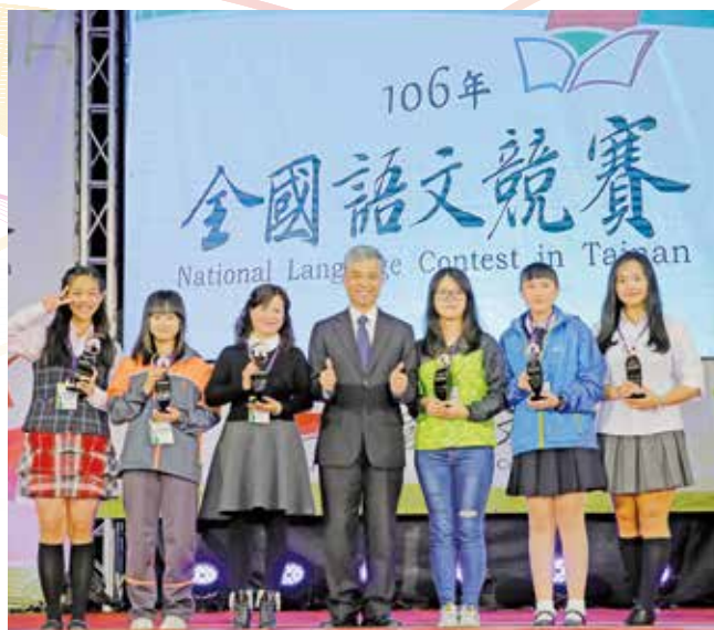
2017年全國語文競賽開幕暨頒獎典禮。