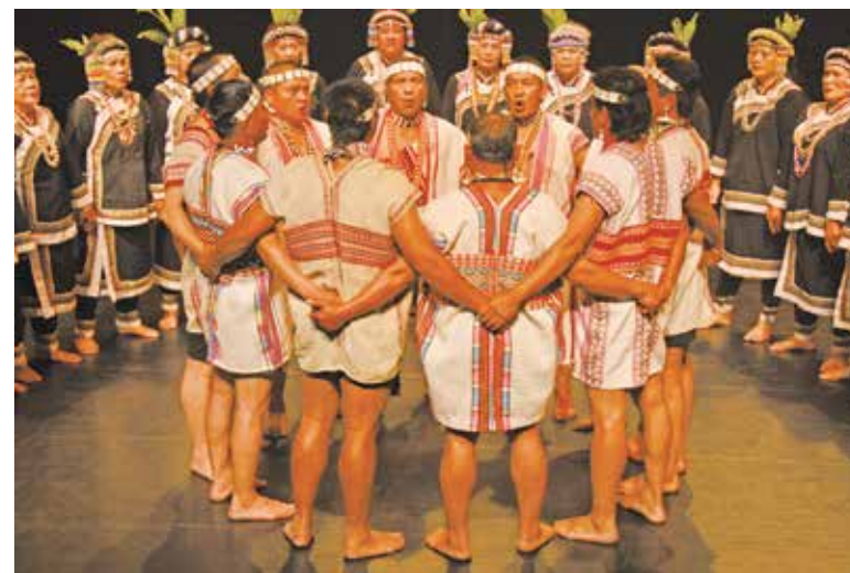
南投縣信義鄉布農文化協會演唱Pasibutbut。