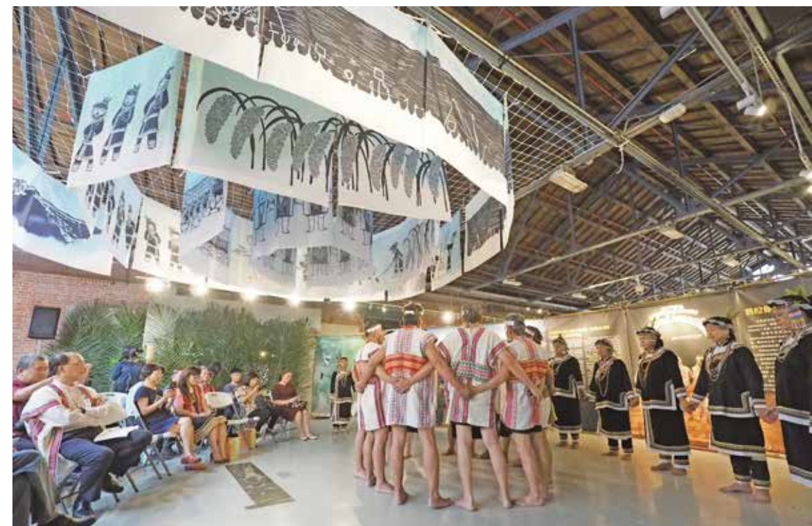
開幕典禮演唱pasibutbut。

「Pasibutbut」在布農語中接近「拔河」，其聲響結構在聲部往返拉鋸之中，持續微分上揚，趨向最終的和諧。就聲部結構來看，它是一首四聲部的複音歌唱，以最高聲部微分上行的旋律線作為骨幹旋律，而下方三聲部對應著骨幹旋律依次作級進下行的複音式開展；而後，隨著音域不斷提昇，這個複音結構不斷透過「解構與重建」的過程，不斷地循環出現，形成如瓦片般堆疊的音樂織體，直至歌者的音域極限，請見譜例1圖示。