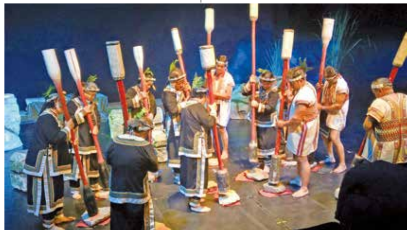
南投縣信義鄉布農文化協會演奏杵音。

在「布農族音樂Pasibutbut」2010年被登錄為國家級文化資產後，近十年以來，Pasibutbut的傳唱熱忱亦廣泛在台灣各地布農族部落間傳遞著。其結果，除了「南投縣信義鄉布農文化協會」獲得國家級文化資