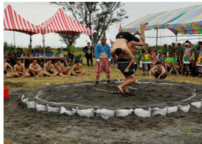
2016年於都蘭鼻舉行新階級命名與晉級儀式前的擇角比賽。

筆者在都蘭最常聽到關於與海互動的詼諧說法，多半是「大海是我們的冰箱」、「窮到只能吃龍蝦泡麵」著實顯現出都蘭阿美人