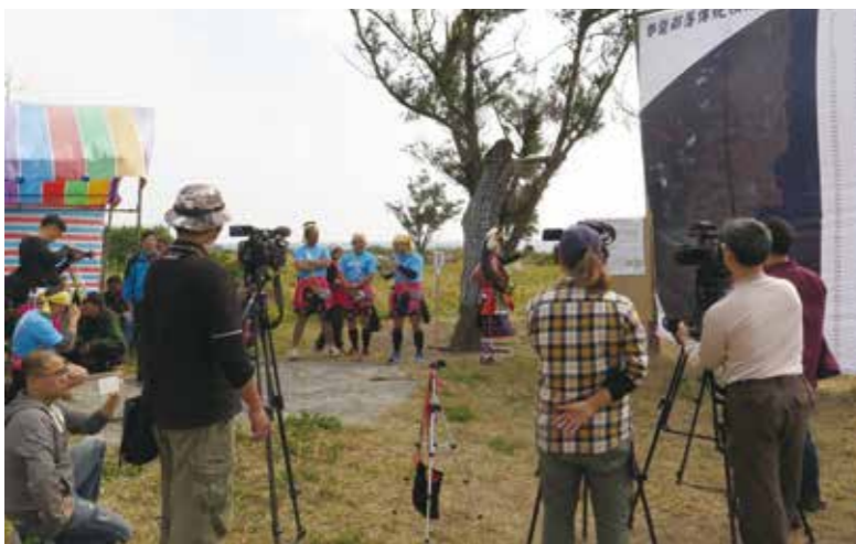
2017年2月28日於都蘭鼻舉辦都蘭部落傳統領域管理原則宣告記者會。

為雖不同於山區狩獵因使用火藥槍械而受限制，但在國家政治經濟體系的介入下，海洋從原本作為生活互動的領域，進而變成予取予求的資源場所。1960年代，貨幣與資本經濟已完全改變都蘭阿美人的生計方式，許多都蘭青年雖仍依循與海的關係而投身遠洋漁業，但在政府防範匪諜而佈署海防部隊的政策下，阻隔了都蘭阿美人與海洋自由接觸的機會。緊接海防部隊撤哨而來的，是1990年代從國家發展遊憩觀光視角下的空間治理，完美地展現了國家對於限制族人使用魚槍與漁獵採集活動的宰制。2000年以後，都蘭部落為因應人口流失、年齡組織產生斷層而推動的文化復振日益見效、文化資本得以逐漸累積，因此每年kiloma'an祭典皆吸引許多觀光客前來。在滿足異文化獵奇心態與悠閒度假氛圍的想像下，沿岸地帶再度受到政府青