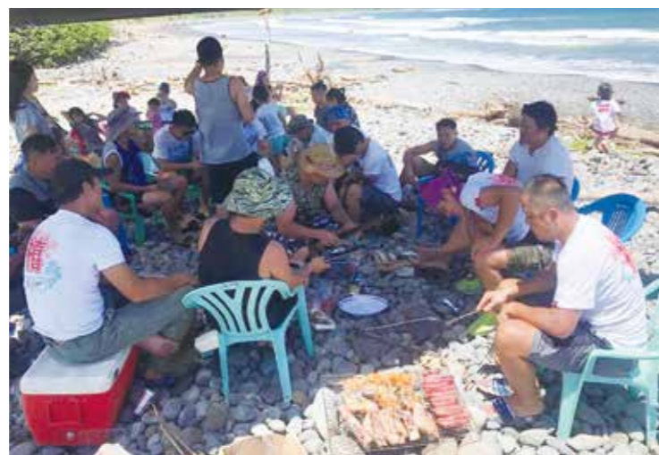
到海邊進行pakelang（洗塵），為都蘭阿美人每當重要婚喪喜慶結束前，回歸日常生活 的重要儀式，圖為2018年拉干禧於kiloma'an祭典結束前於cikayakay進行pakelang儀式。

因為都蘭部落是位於都蘭灣境內的其中 一個部落，與鄰近的興昌，荖桐與伽路蘭等 部落皆有非常密切的往來與互動。對於領域 部分，可能會有重疊，都蘭部落願意與每個 部落好好地溝通與協調，在不破壞性的原則 下，共同守護都蘭灣這塊美麗的環境。未來， 鄰近幾個部落若有都蘭部落協助之處， 我們也將盡力協助與合作。