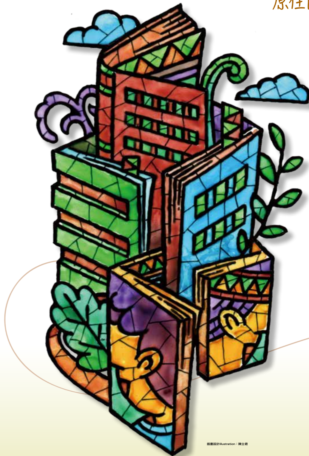
插畫設計 illustration: 陳立君