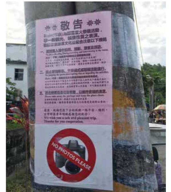
透過宜灣部落的豐年祭告示，可以知道邵族人對於觀光客獵奇攝影行為的禁止與規範。

世居日月潭的邵族，他們的過年是「祖靈祭」（Tungkariri Lus'an），在持續一個月的祖靈祭典中以農曆8月1日至5日最重要，他們也選擇8月1日過年的第一天做為民族國定假日。有一個舉辦37年並闖出國際名聲的活動「萬人泳渡日月潭」，舉辦時間在農曆8月1日至15日（中秋前）選一個週末進行。在近10年裡有6次撞期，泳客們誤闖祭儀空間造成很大的干擾。2019年「日月潭萬人泳渡活動」又和邵族的Tungkariri Lus'an祖靈祭撞期，我因為擔任文資局原民輔導團的職責，有機會參與雙方的協商會議。因為長期不溝通的積怨，協商當天，邵族人義憤填膺，晨泳會也嚴陣以待。事實上，