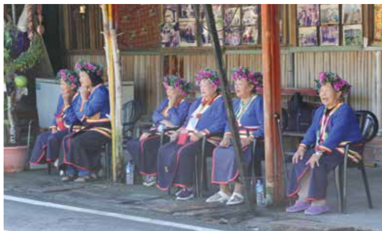
邵族先生媽做儀式的場域：試想若是泳客身著泳裝觀看，邵族人會覺得神聖空間遭受破壞。

我們認為全民原教的概念相當重要，因為過去大家的重點都放在原住民族本身的教育問題，但是現在「全民原教」的概念已經擴及到非原住民族身上，因此，兩者之間的差異與如何執行，需要在概念上釐清。