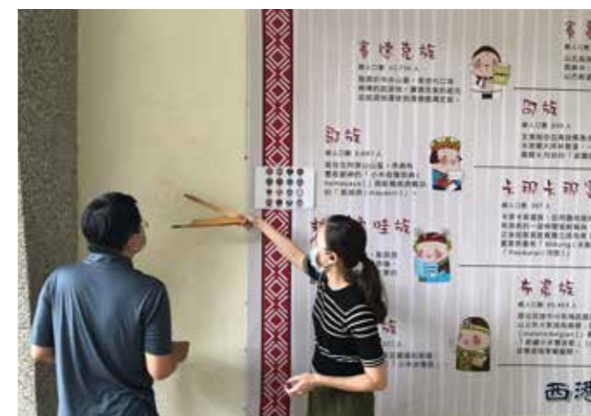
結合「校園原民學習角計畫」大圖輸出呈現的民族圖騰彩繪。