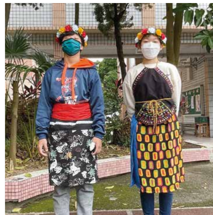
學生穿戴卑南族服飾及花環。

桃園市政府教育局於109學年度起，籌備「桃園市國小教育階段都會區原住民族教育課程策略聯盟」，將都會區的12所國小串聯整合，共同推動原民課程，培養學生們對原住民族文化的理解、欣賞及尊重，落實原民教育，逐步達成「全民原教」的願景。