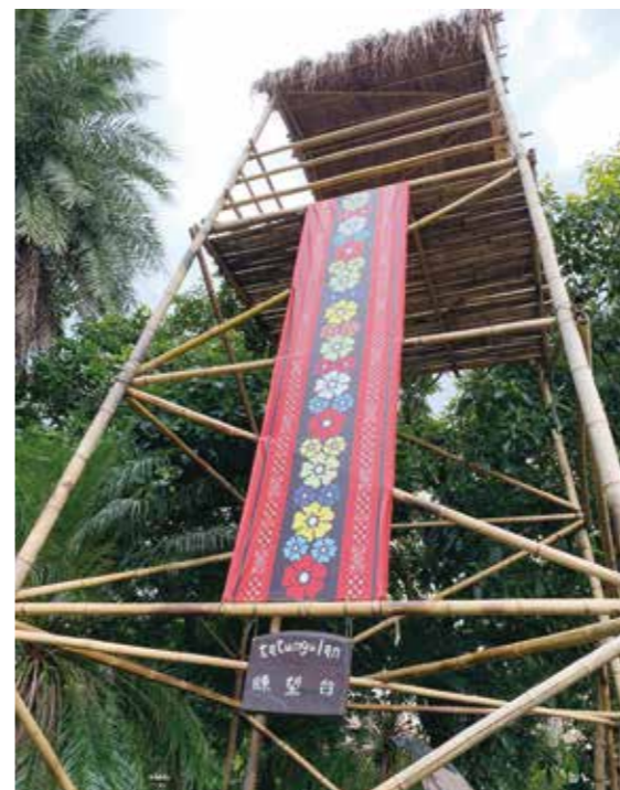
卑南族耆老使用在地桂竹、孟宗竹搭建而成的瞭望台。

目的弱助而少期 的教育勢並達數盼 之族展原「教族大 群礙民本育基群不 及者障法第4條分 其扶到提心族 他，到，力，暨