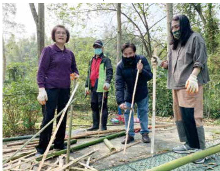
族語教師們合力建置原民植物園區。

而後，透過本市教育局長官的擘劃與支持，以及本策盟工作會議決議，110學年度本策盟學校的推動主軸分別為：福源國小「卑南族飲食文化」、龜山國小「阿美族野菜文化」、幸福國小「阿美族歌舞文化」、大勇國小「阿美族服飾文化」、瑞豐國小「賽德克族飲食、工藝、繪畫文化」、武漢國小「排灣族服飾文化」、百吉國小「泰雅族樂舞文化」、大溪國小「泰雅族飲食文化」、田心國小「泰雅族狩