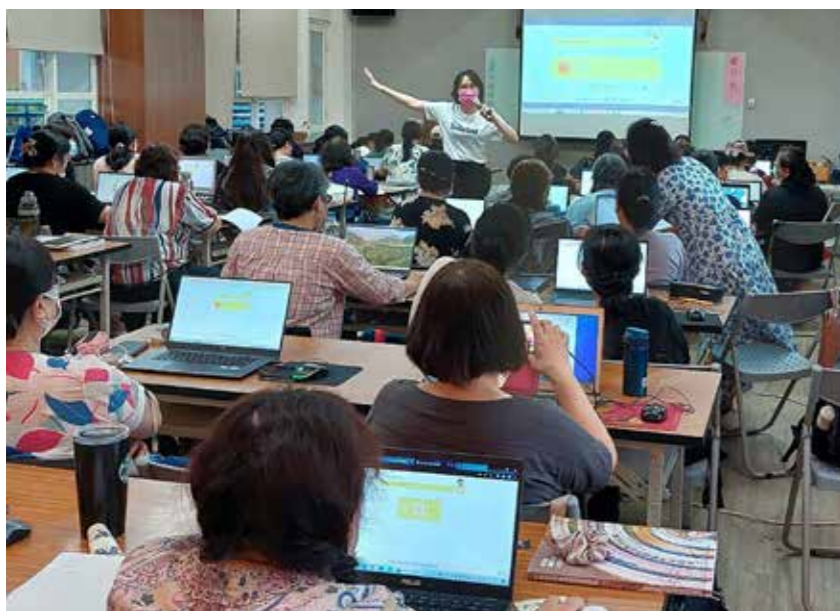
專職族語老師參與教學課程及知能培訓研習。