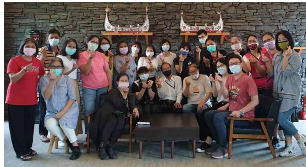
兼具教學專業與熱忱的專職族語老師。

從部落來到新北市之後，原先我在幼兒園工作，2001年政府推行語言復振計畫，我的心中既焦慮又高興，一方面為了我們的語言可以傳承下去而