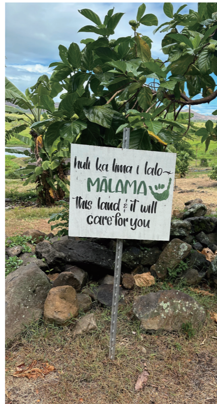
Kauluakalana 在芋頭田旁設立的標語，照顧土地將照顧你。

Kapu 管理及保育，確保未來能永續使用，如：在特定魚類繁殖期間禁止捕魚。土地使用的方式取決於地貌，山區可能會種植高大的相思樹，作為造船用木之外也維護山區的森林覆蓋率。在土地肥沃且有河流經過的山谷中，族人可能會種植水芋 (kalo)。在河流出海口的地區，族人則會製作天然魚池，作為沒有漁獲或者禁止出海漁獵期間攝取蛋白質的來源。