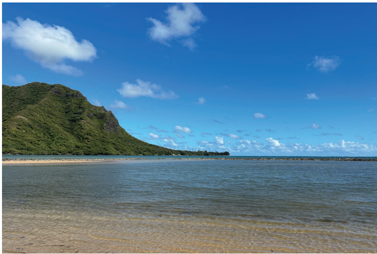
Ahupua'a □ O Kahana (名為Kahana的Ahupua'a) 其出海口名為Ko'olauloa的天然魚池 (fishpond)。

越來越多地組織提倡從照顧土地恢復 ahupua'a 的使用，像是 Kauluakalana 這個 2019 創立的非營利組織，坐落於歐胡島東南部的 Kailua 的 ahupua'a，透過培育當地青年，以及外部志工協助的力量，希望可以讓 kanaka maoli (夏威夷原住民) 和 'aina (土地) 重新團聚一起。