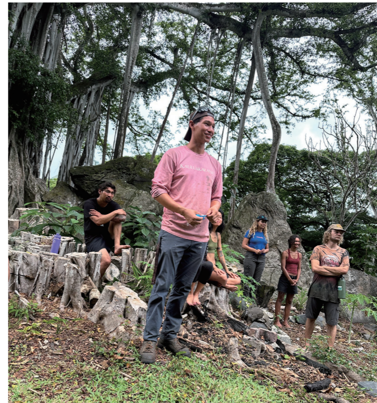
Kailua 的 Konohiki (管理者) 和大家分享土地經營故事。

Kapu 管理及保育，確保未來能永續使用，如：在特定魚類繁殖期間禁止捕魚。土地使用的方式取決於地貌，山區可能會種植高大的相思樹，作為造船用木之外也維護山區的森林覆蓋率。在土地肥沃且有河流經過的山谷中，族人可能會種植水芋 (kalo)。在河流出海口的地區，族人則會製作天然魚池，作為沒有漁獲或者禁止出海漁獵期間攝取蛋白質的來源。