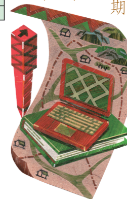
花東區域發展最小尺度的聚落單元，盤點出46種可能樣態。

長期以來，東部區域的國土計畫專業量能與相關人才較為欠缺，花東地區長期也因缺乏空間發展人才的培育體系，使得東部區域發展規劃仰賴著西部專業資源的進駐與協助，而未能系統性建構在地專業團隊與專業支持網絡。