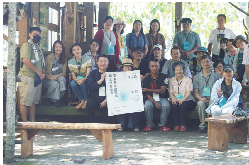
台東縣南迴區域聯合田野調查活動。