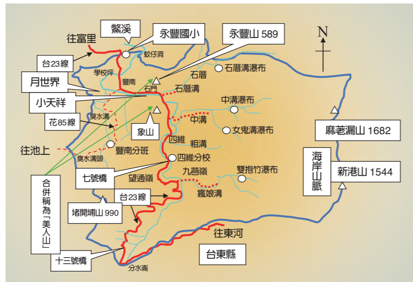
永豐國小地理位置圖。

本校座落在豐南村頂埔東南邊山背坳地，地勢高聳，讓學校具備了絕佳的觀景角度，可俯瞰肥沃的梯田美景。而學校所在區域，因鄰近溪流、山豁、梯田等各項地形，加上低密度開發的前提，天然環境資源豐富且多元。因此，學校發展民族教育課程，便以「食農教育」、「自然環境」、「民族文化」爲主題，注重在地文化學習。