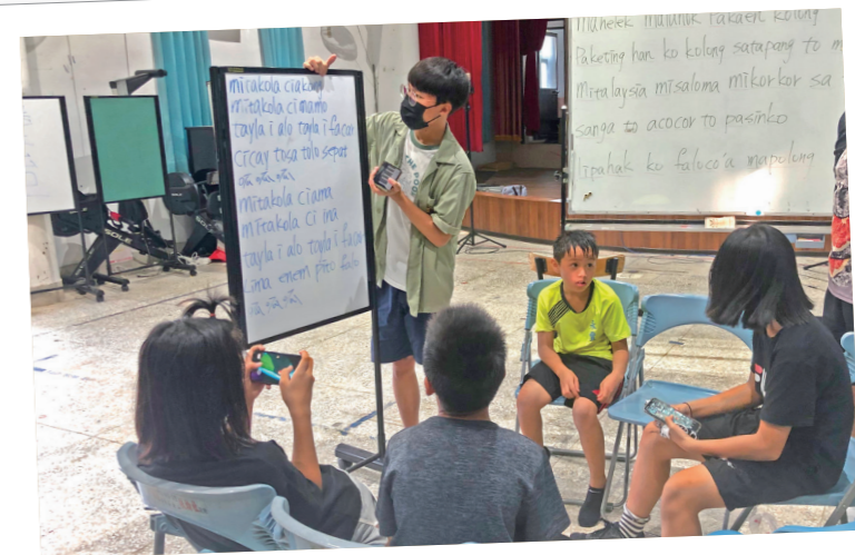
學生認讀練習新創歌謠歌詞中。

以在地課程做起點，文化課程爲內涵，建構良性成長互動的學習環境，從接納擁抱大自然中，讓孩子認識自己生活的土地，對故鄉更有理念與抱