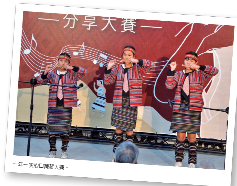
一年一次的口簧琴大賽。

理想。我們期待博屋瑪的教育模式，讓學童習得尊重與包容，進而欣賞不同的文化及生活樣態；再來，讓文化融入在課程及學習生活中，將傳統與創新調和並連結；最後，將理