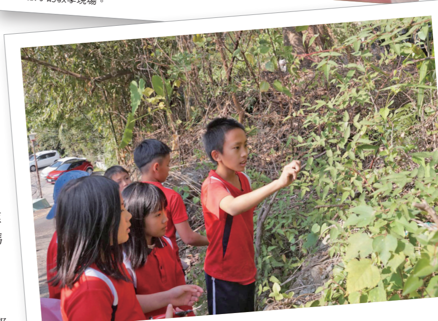
認識部落植物與戶外採集。