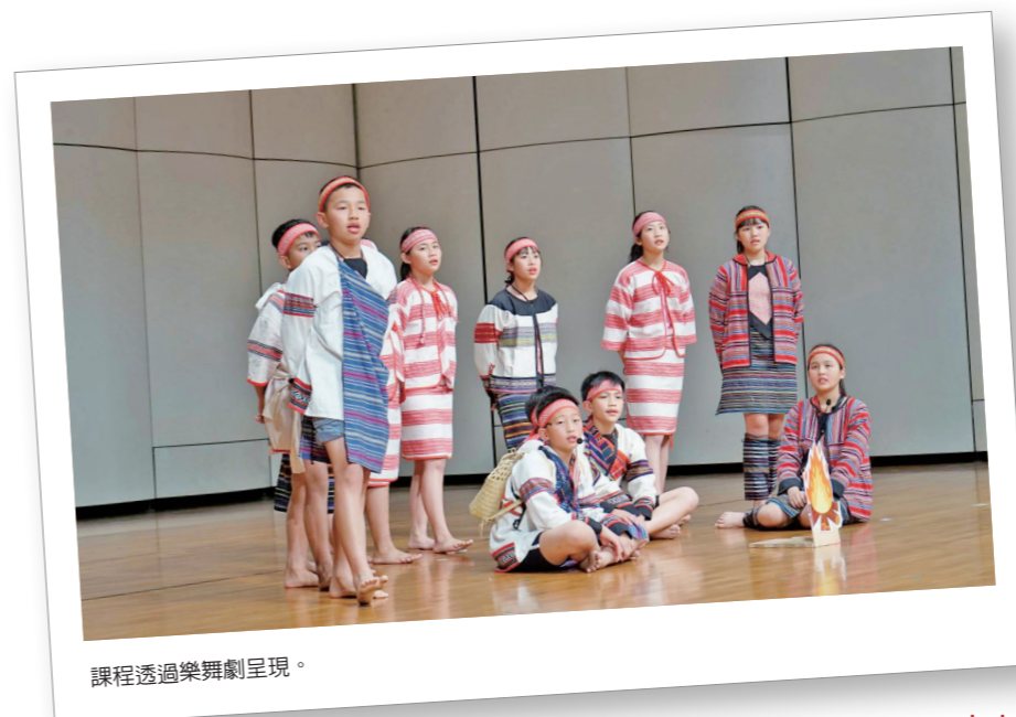
課程透過樂舞劇呈現。

應聯合國永續發展教育，提出「新世代環境教育發展」學習藍圖，期待能實踐於各教育階段。而博屋瑪自111學年起，重新檢視並從泰雅文化及生活中找出對應並連結，轉譯屬於博屋瑪的SDGs指標，透過轉譯後能產出教學示例，真正落在教學現場。