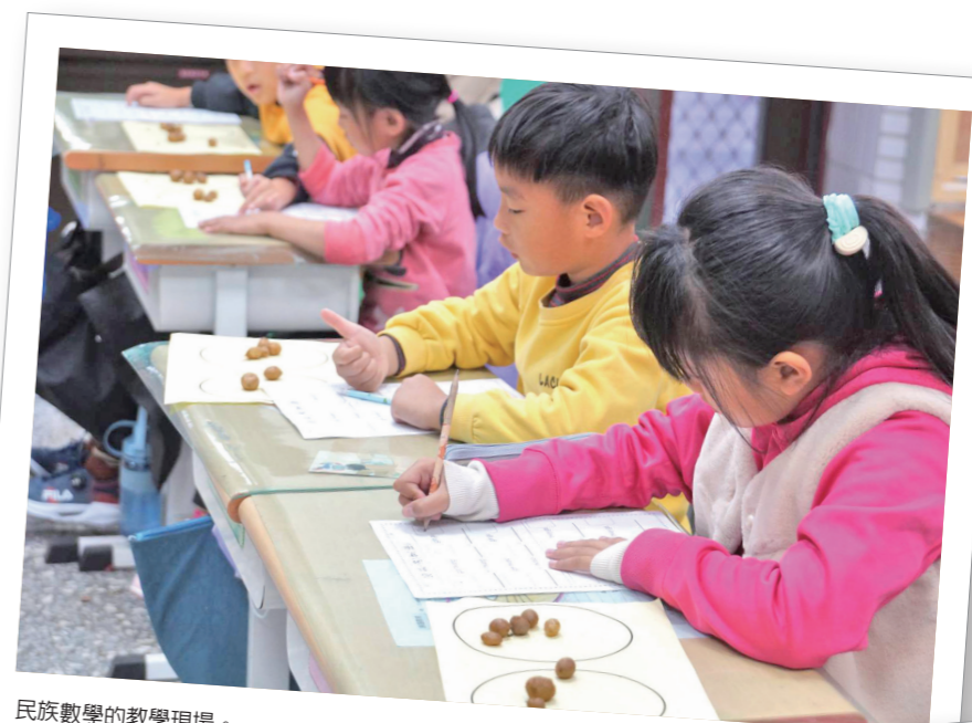
民族數學的教學現場。

博屋瑪國小雖位於原鄉部落內，但在校內親師生、專家學者及部落耆老的共同努力下，走出了不同於一般學校的