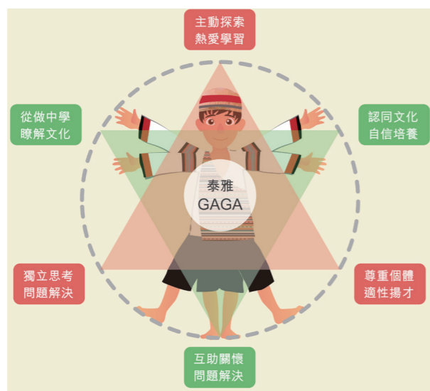
博屋瑪國小學童圖像-全人泰雅。

泰雅族的古詞，原意有三：一是媽媽哺育嬰孩或是親吻的動作；二是昔日泰雅族人使用菸斗時，互借火種的動作；三是在烤火時，將柴薪聚集使火勢變大的動作。是以，將其原意