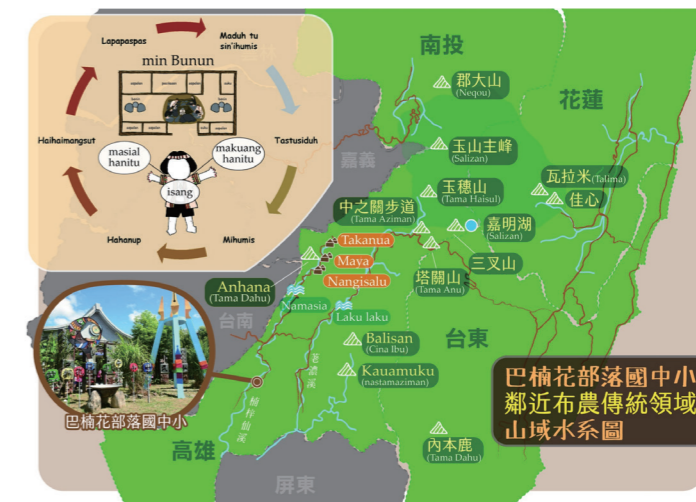
圖3：以「身體」走入山靈小米生活圈的實踐體驗行動—小米生態、家屋氏族、生命儀禮、獵者領域、物質技藝、巫者照顧的認識周期循環體驗與蘊育與他者共命完整心靈經驗歷程。

一方面呈現多族並存，也幫助多族群背景孩子，重新思考自身文化是否也消失與反思尋求歷史文化意義路徑，二方面搶救山林布農的自然共存母語智慧；這中間操作需要長時間沈澱與不斷體驗反思成熟歷程，集體產生「文化眼睛與多族意識」，而非紙本測驗就能體現文化主體意涵與多元並存意義；因為，它牽涉跨世代的族群互動經驗，上一代記憶充滿著衝突矛盾妥協，而下一代失去族語文化現象，在主流族群共同成長經歷中，如退休主任所說：「原