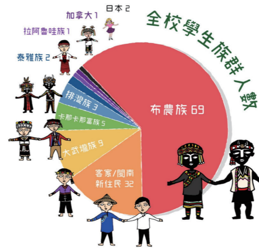
圖6：111學年國中小「布農：多族」族群學生來源結構比。