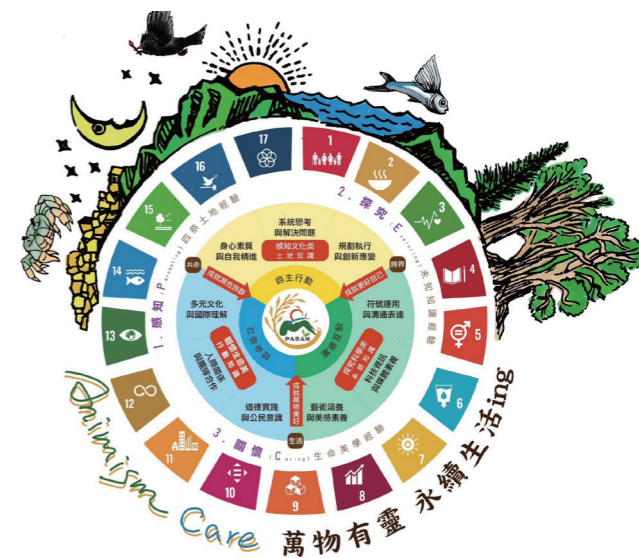
圖7：地球萬物有靈照顧圈。

（秋冬春夏）課程設計的建構及形構自然共存禁忌智慧取向的山靈小米生活圈體驗主題；接下來需深化認識台灣以山林為主體的島嶼記憶，我們規劃以「身體為生命座標」的春祭全校各年級敬山主題學校課程：三大山林布農古道（圖3），將校園內營造山靈小米生活圈的SDGs學習情境走出校園（圖4），進入布農族遷徙山林路徑中，整合身心試煉與史、生態、議題探究行動一深化實踐六大主題的人地共命視野，回應氣候變遷教育的「人與Hanitu 萬物靈時間性」的課程認識行動與族群夥伴多元依存關係。