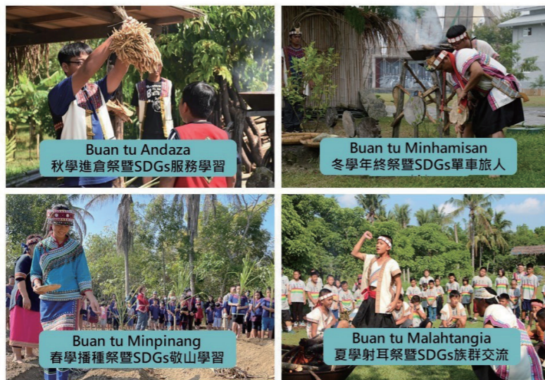
圖5：文化四祭秋冬春夏，教會我們人與他者遭遇相連的內在體驗記憶與柔軟彼此心靈的故事根源。

解「矛盾對立意識」形成新族群關係的共同體視野，也是學校自102學年起採取連結「自然共存」為中介取向的小米農事歲時祭儀（一年自然時序時間），讓各族群找回守護自然與敬畏自然的心，共同回到族群大地母體意識，連結「山林萬物有靈的連結Hanitu共同體經驗行動」，同步回應「傳統自然禁忌智慧與未來氣候變遷教育」課程脈絡下，重構原住民族貢獻生態族群位置與創造時代地球公民價值。