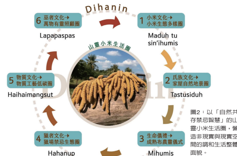
圖2：以「自然共存禁忌智慧」的山靈小米生活圈，營造非現實與現實空間的調和生活整體面貌。

境生活，嘗試移位轉動到布農族小米農事祭儀時間的雙重思維，形構當下「布農：多族」整體雙重學習產生對比寬闊心靈視角。