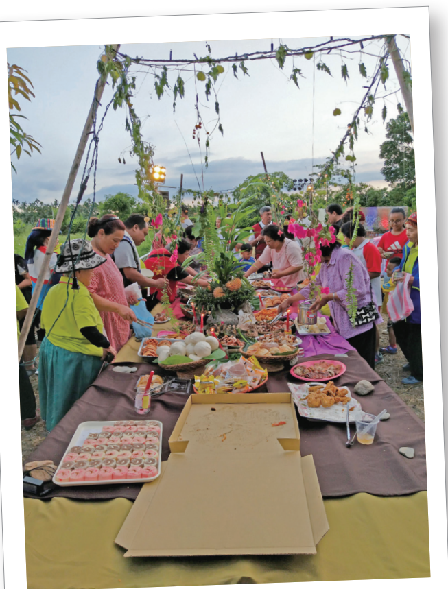
教保中心畢業典禮一家準備一道菜。

原來，這樣的家長紀錄跟分享也是一種不甘心啊！因為在市面上主流的各式各樣幼兒教育選擇下，即使室內教學內容再怎麼優秀，還是難以跨越教學空