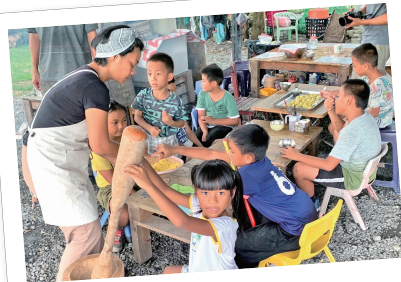
製作傳統小米湯圓。

當時我問馬主任：「面臨每次北上爭取權益或在研討會場合，那些不理解的話語不累嗎？」她用很魯凱排灣長輩的智慧說：「我們沒有要成為主流，我只想守護住這條小溪流。她雖然小，但生態很豐富，也許有鹿經過會喝一下，溪邊有很多植物需要她。雖然我們沒有要成為主流，但如果主流來壓迫到