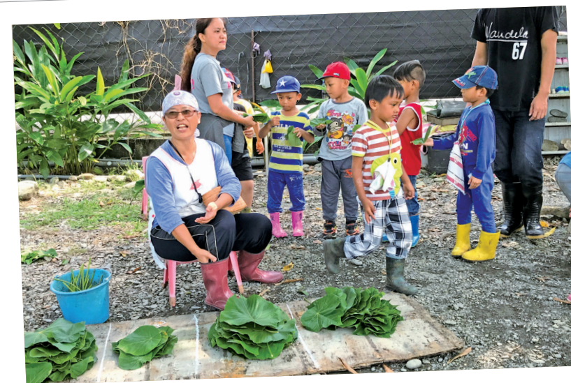
獨特的部落學力測驗。