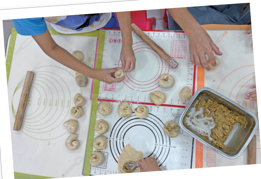
製作小米酵母麵包。

不知道從哪一年開始，教保中心開始給我們工作室機會，跟我們分享田裡收穫的食材，不但讓我們練習教學，還研發適合孩子們食用的點心，讓我們能夠從傳統的農耕收成到糧食，轉換成教學能量與課後點心。例如原生種的小米麵包，回到學校送給孩子們分享